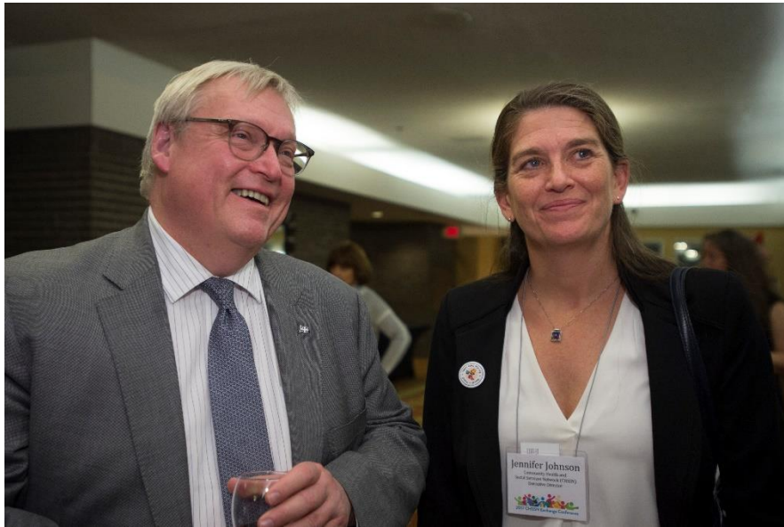
Gaétan Barette, Ministre de la Santé et des Services sociaux